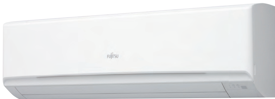
ASY 80-100 Ui-LM