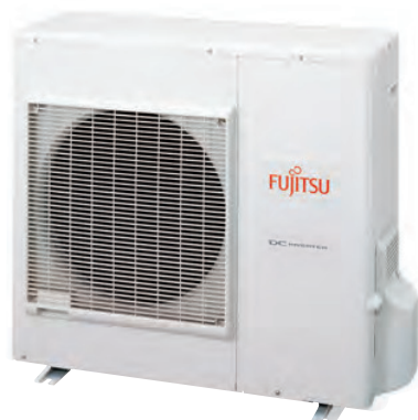
ASY 80-100 Ui-LM