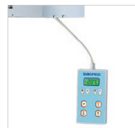
Panel de control remoto con cable de hasta 5 metros.