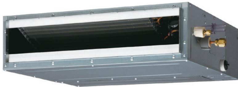
ARGD 4-14 G