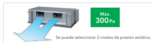
Alta presión estática (ARGC 72-90).

Peso ligero: se ha desarrollado una unidad interior compacta y ligera reduciendo el chasis básico y el peso total del material.