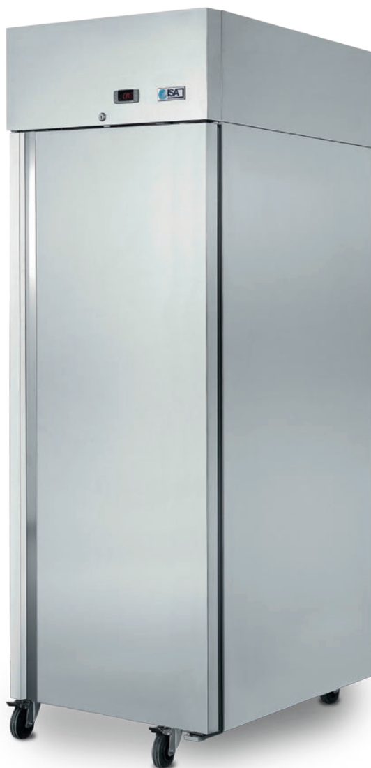
LABOR 70 RS RV TB