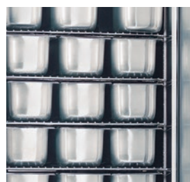
5 estantes en dotación regulables en altura. Posibilidad de colocar 5 estantes más, ampliando a 11 el número de niveles de carga.