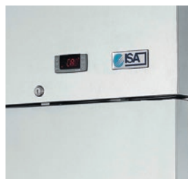
Central electrónica para la regulación de la temperatura.