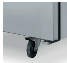
Ruedas para un desplazamiento fácil.