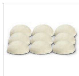
Bolas de masa.