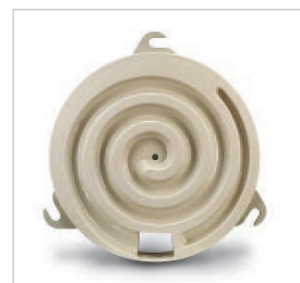
Campanas que permiten la formación de las bolas por rotación.