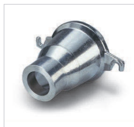
Conos para determinar el calibrado de la porción.