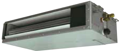
ACG 12-14 UiA-LA